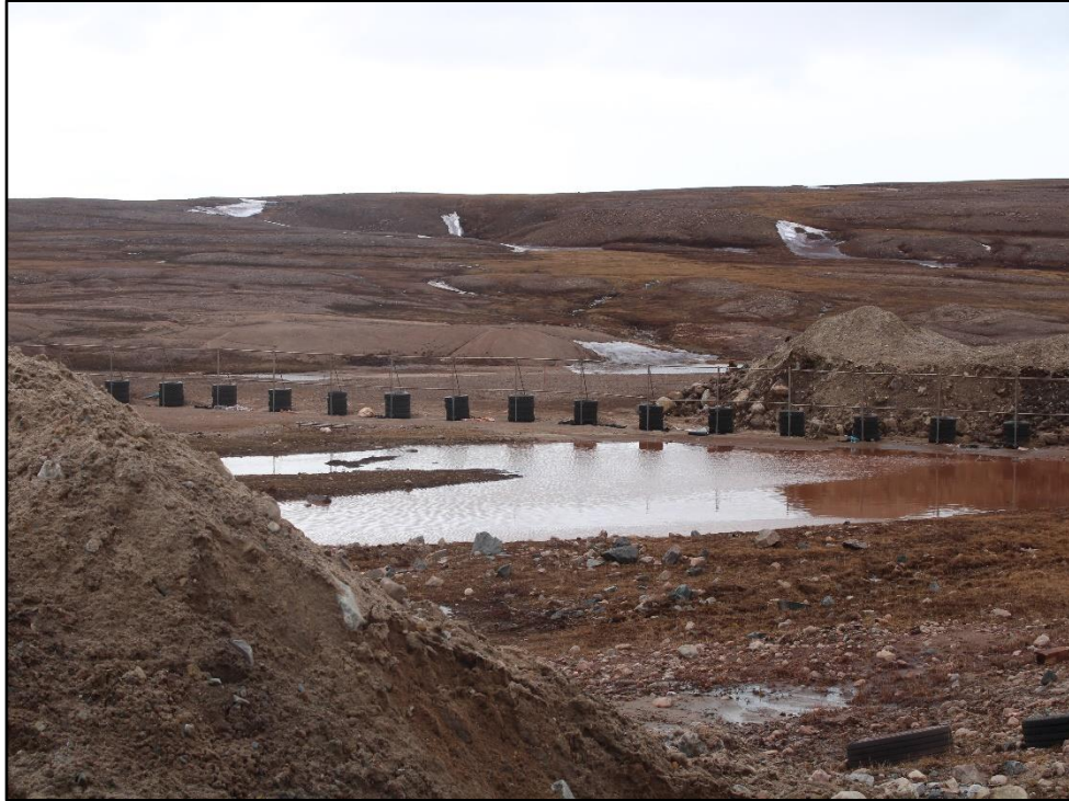
ᐊᓐᓂᓂᐊᑦ 16: ᐊᑦᓗᑦ ᓂᓗᓂ ᐊᑦᑕᑑᐃᑦ ᓄᓇᑦ ᐃᓗᐊᓄᐊᑦᑕᑑᑦᑕᓐᓂᓐ.