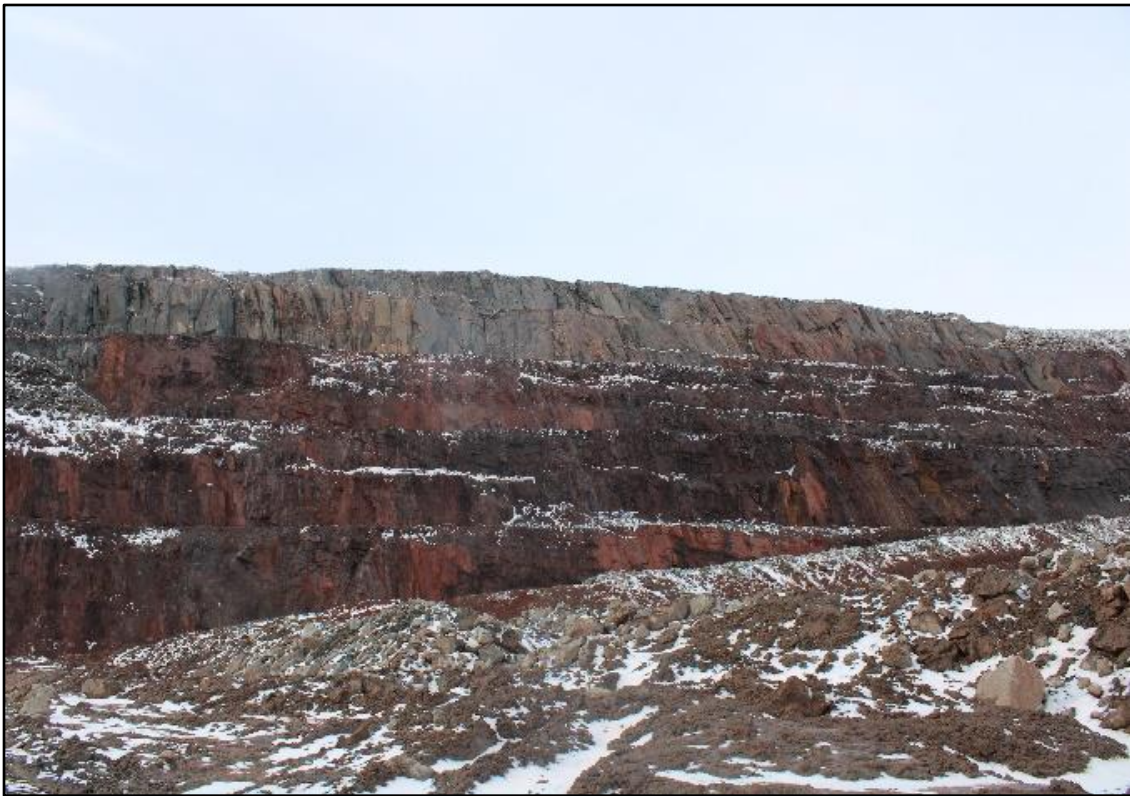
ᐊᓯᓐᓂᐊᑦ 6: ᐅᓕᓕᓂᐊᓂᑦ ᐃᓕᐅᑦ 1 ᐃᓕᓕᓂᐊᓂᐊᑦ ᓄᓕᓕᓂᑦ ᓴᓂ 2022.