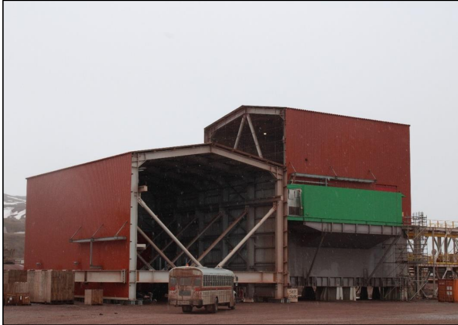
ቅጥረኛ 49: ለገቢዎች 2 ለድርጅቱ ወይም ለሌላ ልሳን ለሚሰጥ ነው።