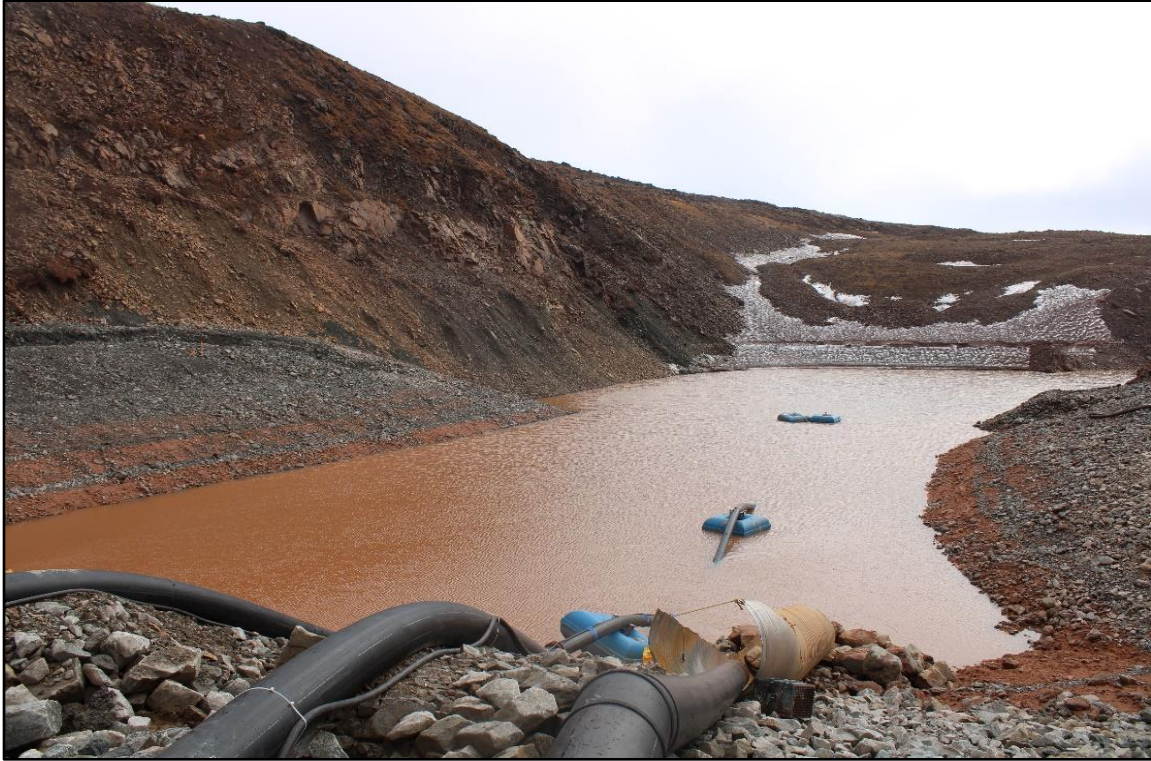
Վերաբերյալ 8: Ինֆրաստրուկտուրայի 1 հ>ՈՒ Լճակ