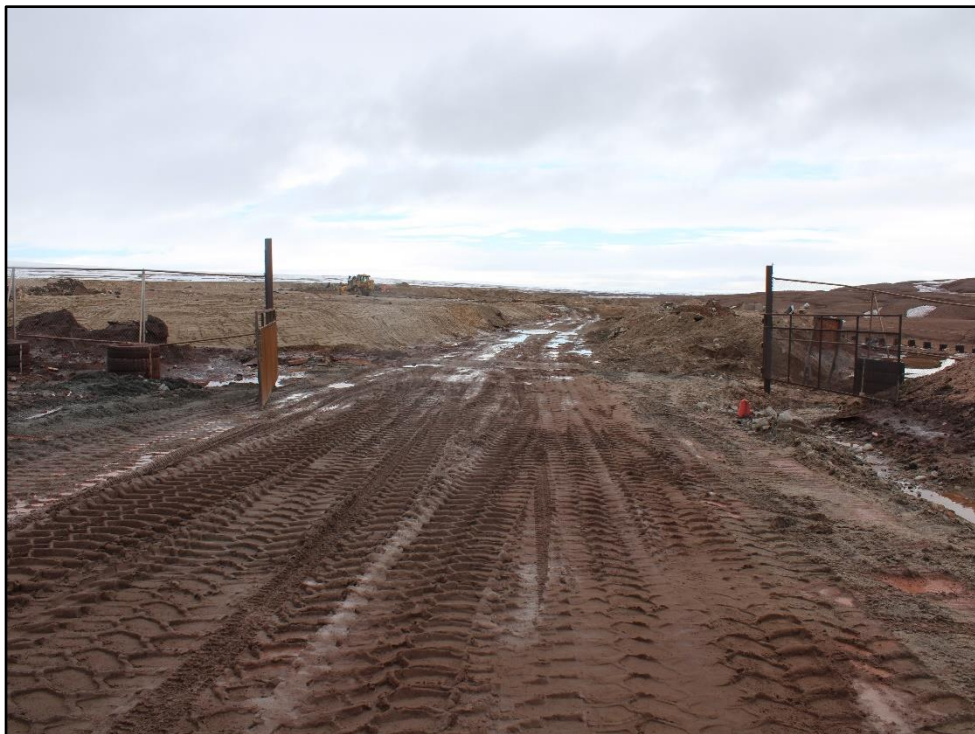
ᐊᓐᓂᓂᐊᑦ 17: ᐊᑦᓗᑦ ᑦᓂ ᓂᓗᓂ ᐊᑦᑕᑑᐃᑦ ᓄᓇᑦ ᐃᓗᐊᓄᐊᑦᑕᑑᑦᑕᓐᓂᓐ.