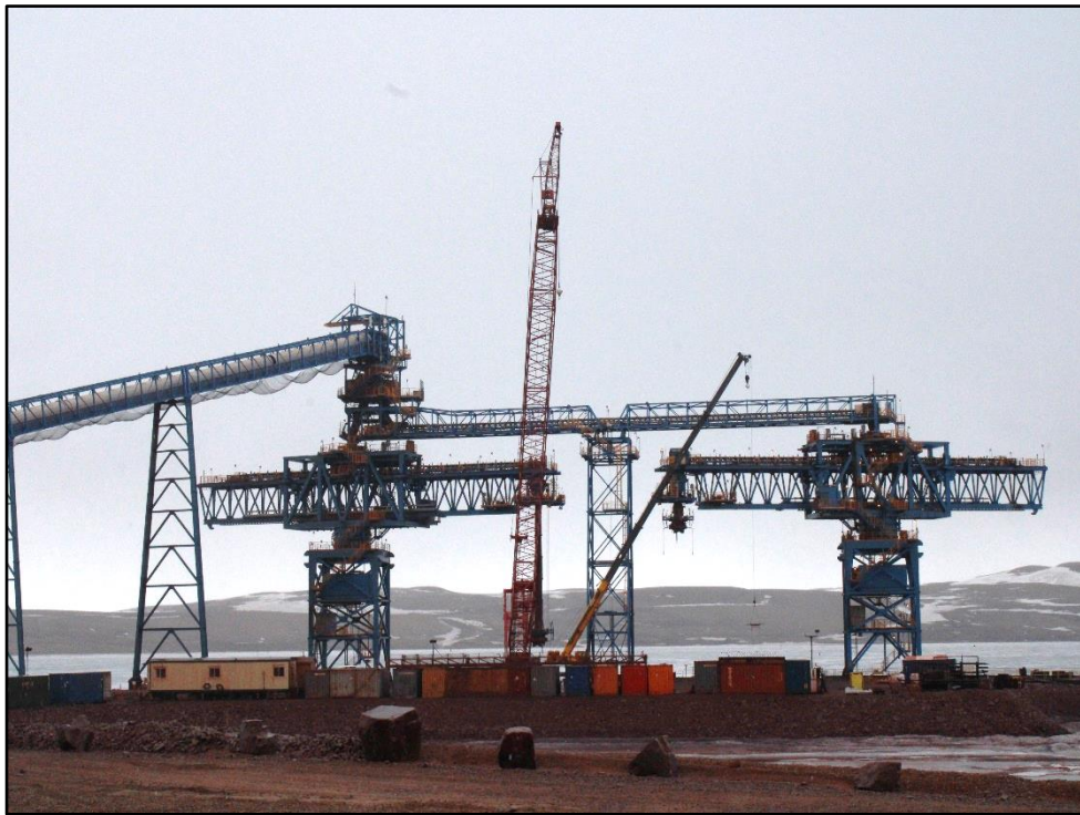
ՎԻՃԵԿ 42: ԿՈՆՏԵՆԵՐԻ ԾԱԽՐԱՆԻՔ: