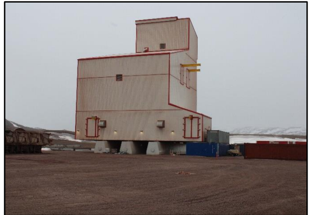
ቅጥረኛ 51: ለገቢዎች 2 ለድርጅቱ ለሚሰጥ ነው።