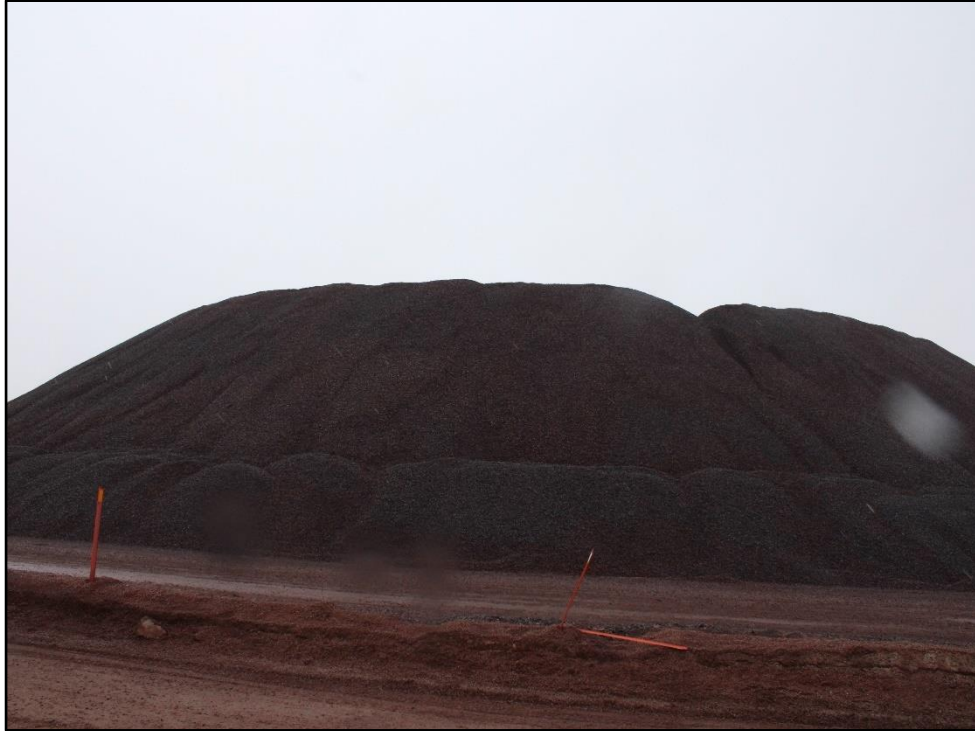
ՎԻՃԵԿ 41: ԿՈՆՏԵՆԵՐԻ ԱՄՈՎՈՐԼԱՐԸ: