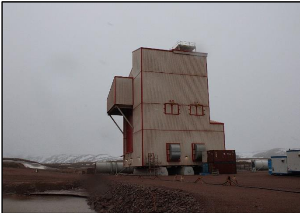
ቅጥረኛ 50: ለገቢዎች 2 ለድርጅቱ ለሚሰጥ ነው።