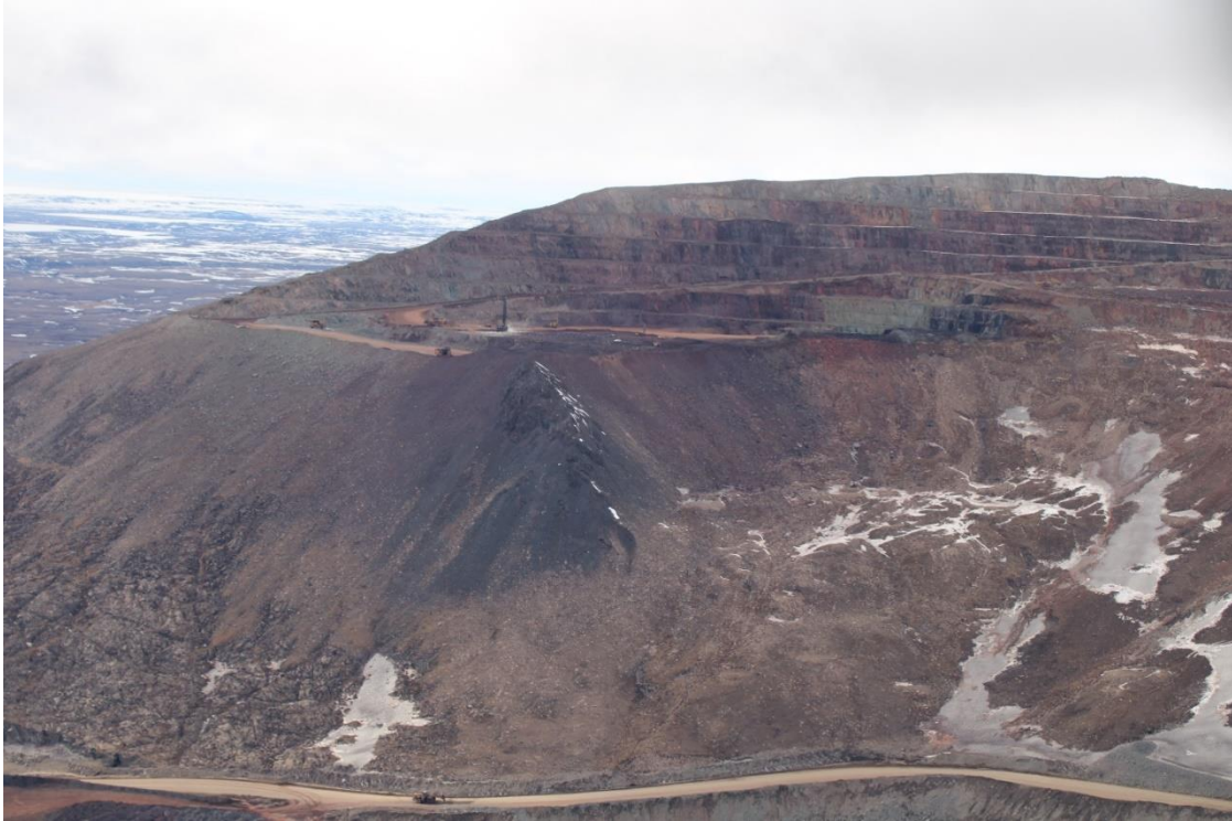
ᐊᓯᓐᓂᐊᑦ 5: ᑭᓕᓕᓯᑦ ᐊᓯᓐᓂᐊᑦ ᐅᓕᓕᓂᐊᓂᑦ ᐃᓕᐅᑦ 1