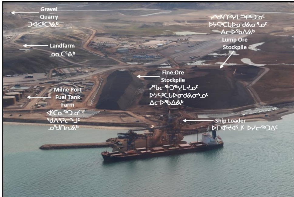
ቅጥረት 1: ንግድ ማሽን ፖርክ ማሽን ፖርክ ጋራፍጥፕ ማሽን ፖርክ, ጳጳስ 2019.