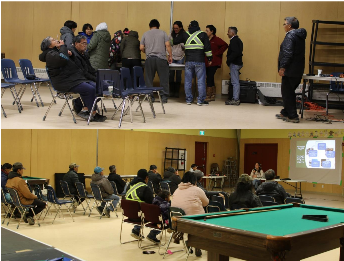
ቅጽ 5: በጽሑፍ ድህረገጽ ለጽሑፍ