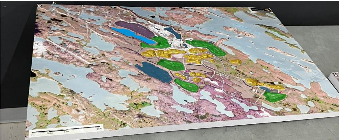
ጥንቃቄ 6: የግብርናው ስራዎች (3-D) “የግብርናው ስራዎች”-ጋር