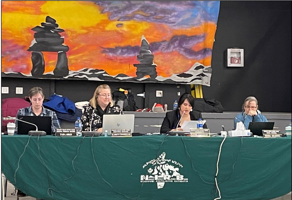
ᐃᓴ 7: ᑭᏚᐸᐱᕐ ᑲᑎᒪᓂᖅ