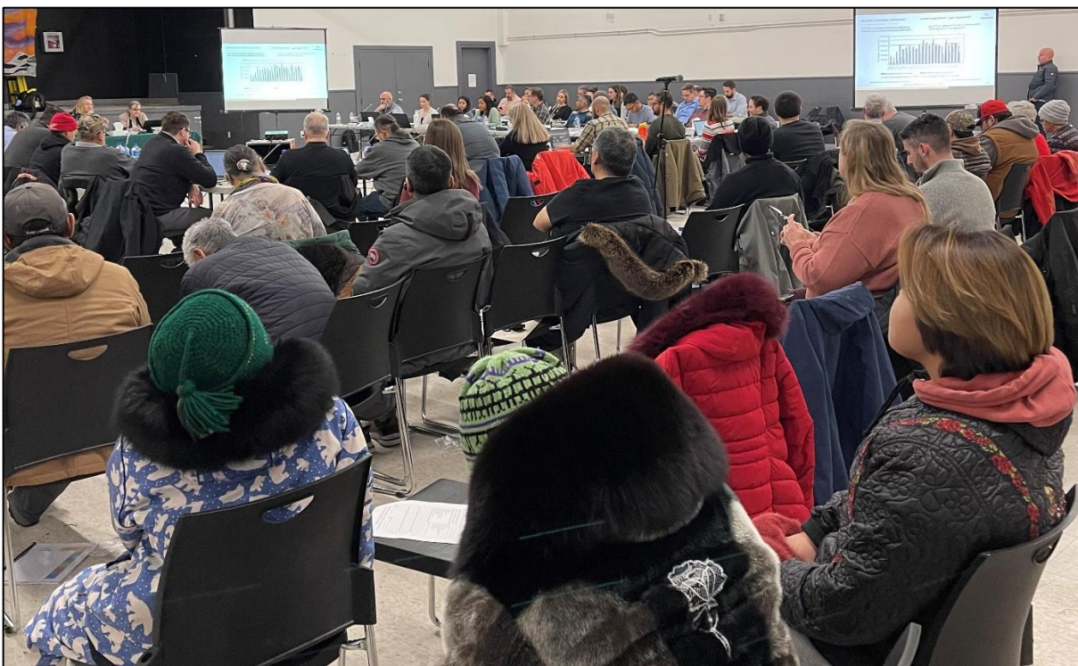
ᐊᓗ 1: “ᑕᓯᓕᐊᓯᑦ ᐅᐃᓯᐊᓐᓯᑦ” ᐃᓯᓂᐅᓯᑦ ᐱᑦᓕᓕᑦ ᑦᓴᓂᑦ ᐅᓯᓕᓯᓂᑦ, ᓂᓕᓯᐅᑕᐃᑦ ᐅᓯᓂᓯᑦ ᐊᓴᓗ ᓯᓂᓂᐊᑦ ᐅᓯᓂᑦ