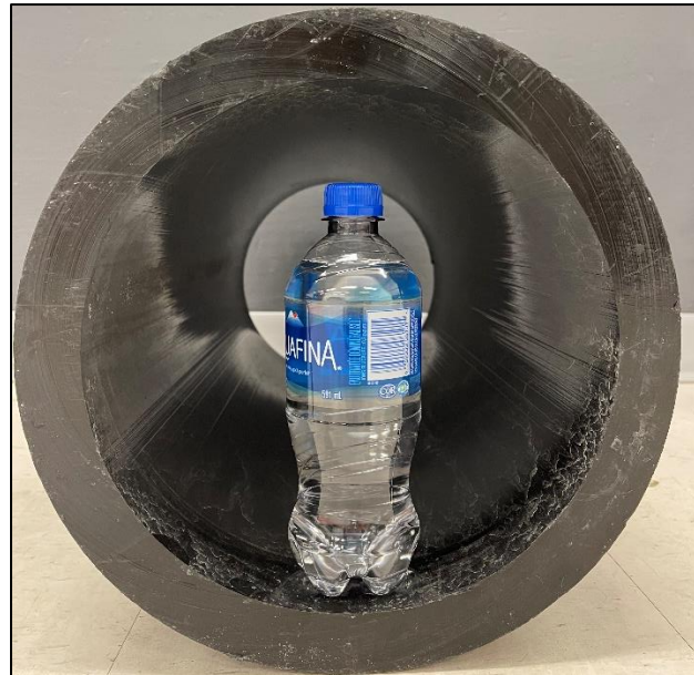
ᐅᔭ 4: ᑎᓴᓂᕈᕆᒥᑦ ᐃᒪᖅᓯᑦ ᐱᑦᑐᓕᖅᓄᑦ ᐅᓗᓂ