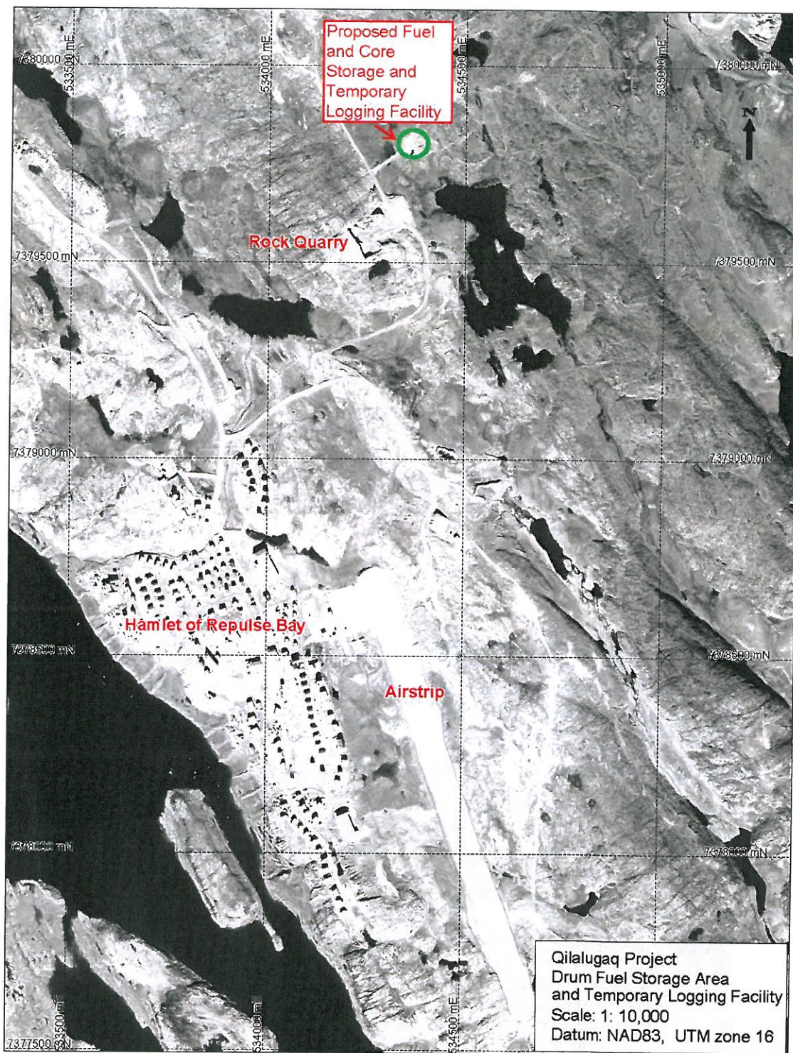
၎င်း ၁: အင်္ဂလိပ်စာအုပ်အုပ်စုအုပ်စု အုပ်စုအုပ်စု

መፋር ልሳብ ያለውን ስልጣን በደረሰበት የፖለቲካ አስተዳደር መሪነት ተሞልቶ ለፖለቲካና ለህዝብ አገልግሎት ሆኖ ለጊዜው ለፀሐይ ሕይወት ማቆም እንደሚችል አስታውቋል።