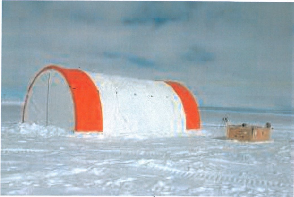
ᐃᓴ 4: ᐃᑕ ᐃᐃᐃᐃᐃᐃ ᐃᐃᐃᐃᐃᐃ