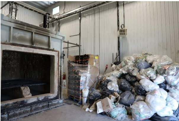
ՎՅՊՎԳ 18: ՎՇՇՃԸ ՃՐԿՈՑԻՐԸ ԵՇՐՔԻ