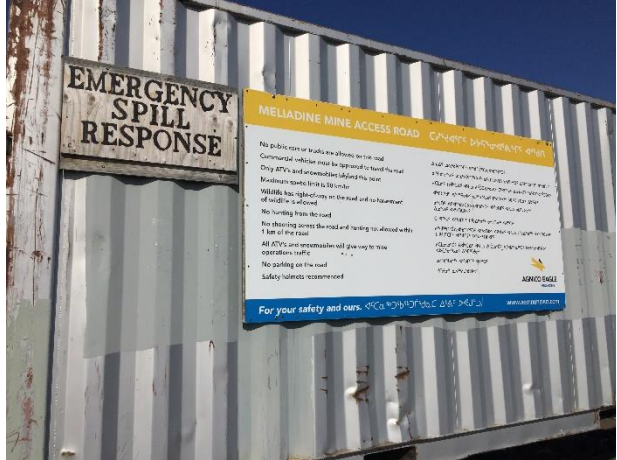
ᐊᓯᓐᓂᐅᑦ 13: ᐅᐊᐊᑦᓇᑦᑲᐅᓯᑦ ᐅᐊᑦᑲᑦᑲᐅᓯᑦ ᐊᑲᓐᓂᐅᓯᑦ ᐅᐊᑦᑲᑦᑲᐅᓯᑦ ᐅᐊᑦᑲᑦᑲᐅᓯᑦ