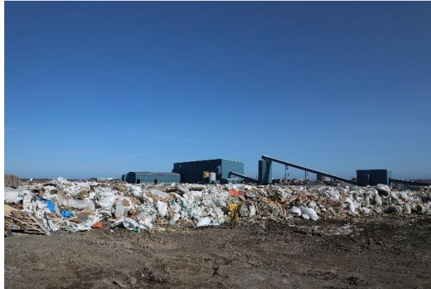
ՎնչՊՎԳ 17. ԺճԴ ԴԿՈՆՔՑԻ ՃԵՄՆԵՐԻ յՅԴ ԵԿԿԻԵՑԻՑԻՑ: