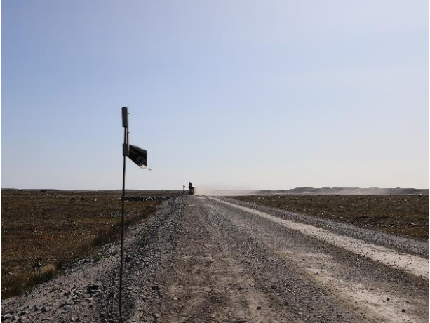
ᐊᓯᓐᓂᐅᑦ 12: ᓄᓇᓯᐅᓯᑦ ᐅᓯᑲᑦᑲᐅᓯᑦ ᑦᑲᓐᓂᐅᓐᓇᑲᐅᑦ ᐊᐅᑦᑲᐅᓐᓇᑲᐅᓯᑦ ᐊᑦᑲᐅᓯᑦ ᓴᓄᐊᓯᑦᑲᐅᑦ