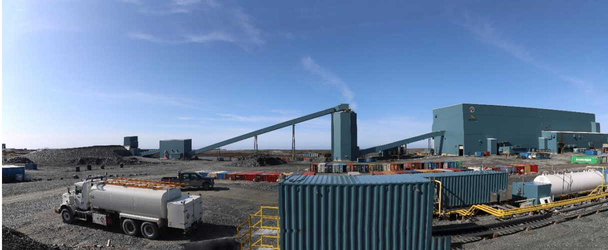
ቅጥሥ 1: የፎከ ላቦሪዎች ልብረት ስርዓት