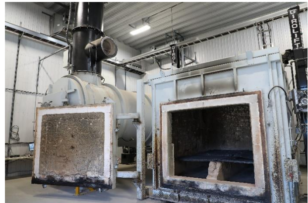
ՎՅՊՎԳ 19: ՃԵՄՆԵՐԻ ՃՐԿՈՑԻ