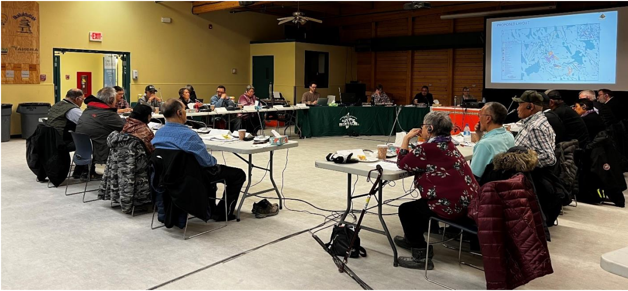
Piksa 1: Hanadjutikhanik Katimayut, Nunallaami Katimaqatigiiktut Hivuani-Katimarjuarniq.